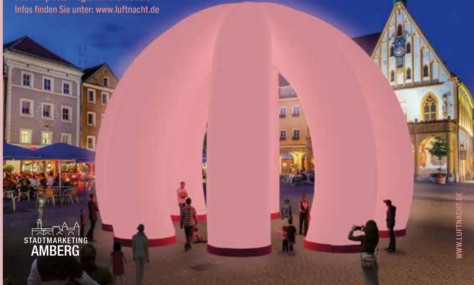
same same an artwork by Amanda Parer • Gestaltung: Büro Wilhelm • Foto Marktplatz: Manfred Wilhelm